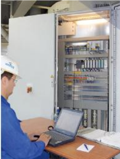
HAVER & BOECKER Maschinenfabrik, город Ольде, Германия